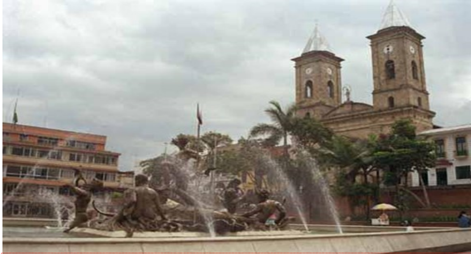
Foto: Parque Principal de Fusagasugá