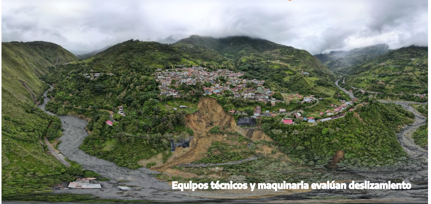
Equipos técnicos y maquinaria evalúan deslizamiento