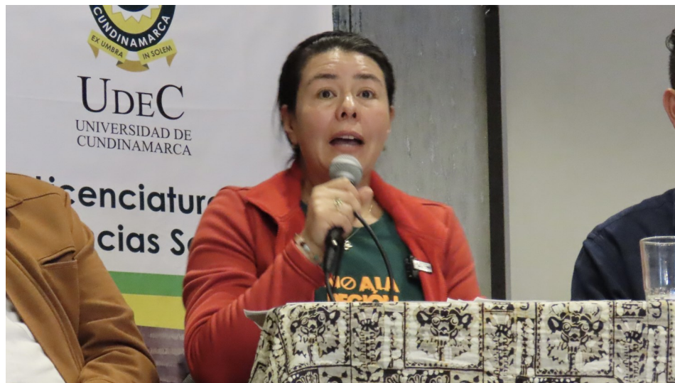
En la Foto: La Diputada Ivonne Tapia

En Tibacuy, la defensa del territorio se ha convertido en un compromiso colectivo. Desde hace varios meses, la comunidad organizada y diferentes expresiones sociales del municipio han promovido espacios de diálogo y debate mediante foros, conversatorios y brigadas informativas para advertir sobre los posibles riesgos de que el municipio sea incluido en la Región Metropolitana Bogotá–Cundinamarca.