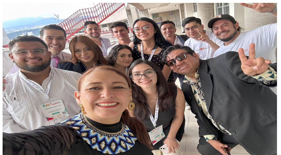
En la Foto: al frente la diputada de Cundinamarca Angélica Gómez

La diputada de Cundinamarca, Angélica Gómez, participó como ponente en el Congreso Internacional de Políticas Públicas en Ciudad de México, en el panel “Mujeres y Democracia”. Allí compartió su experiencia como líder