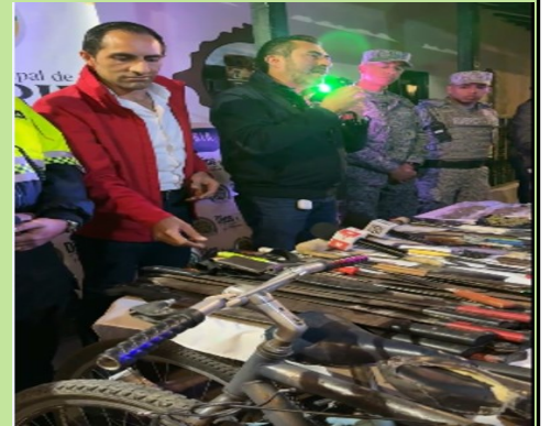
En la Foto aparece hablando el Alcalde de Madrid Cundinamarca Carlos Chávez, junto al Secretario de Seguridad, Policía Nacional y Fuerza Aeroespacial.

En las últimas semanas, se realizaron más de 15 operativos que generaron resultados en seguridad. Se registraron 3. 300 personas para verificar antecedentes, y se capturaron a 13 individuos en flagrancia por varios delitos. Se incautaron 2 armas de fuego ilegales, 2 motocicletas robadas, 100 gramos de bazuco y 25 gramos de cocaína. Además, más de 300 personas fueron llevadas al Centro de Traslado por Protección (CTP) y se impusieron 217 órdenes de