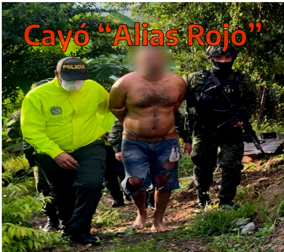
La captura se llevó a cabo en la vereda Terán, Yacopí- Cundinamarca.

Ejército y Policía capturaron a alias Rojo, un líder del Clan del Golfo, en una operación del Plan Ayacucho Plus. Era buscado por la justicia por delitos como narcotráfico y organización criminal. Su arresto debilita las estructuras criminales en Cundinamarca, Tolima, Caldas y Valle del Cauca, reduciendo el poder y la financiación de estas organizaciones. Ver Pág. 2