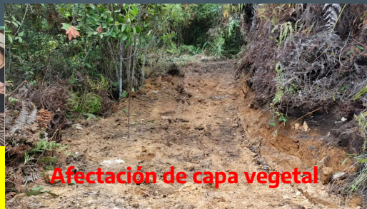
Afectación de capa vegetal