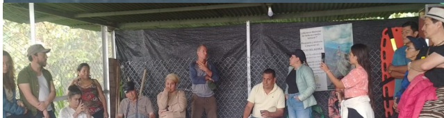
Encuentro comunitario con autoridades en el lugar de la afectación ambiental