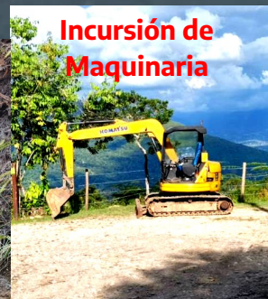
Incursión de Maquinaria

Un nuevo episodio de alerta ambiental sacude a la inspección de Cumaca, vereda El Ocho. El pasado sábado 17 de enero de 2026, lo que comenzó como un reporte ciudadano terminó en un operativo policial que pone al descubierto la fragilidad de la vigilancia en áreas protegidas, en este caso, el emblemático cerro Quininí.