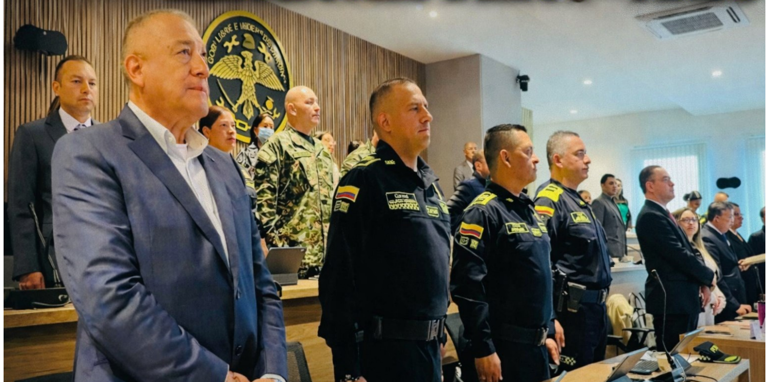
Más de 6.000 uniformados de la Policía y el Ejército garantizarán la jornada del 31 de mayo.

Autoridades del departamento de Cundinamarca desplegaron un plan integral de seguridad, vigilancia y logística para garantizar el normal desarrollo de las elecciones del próximo 31 de mayo, en las que participarían más de 2,3 millones de ciudadanos habilitados para votar en los 116 municipios.