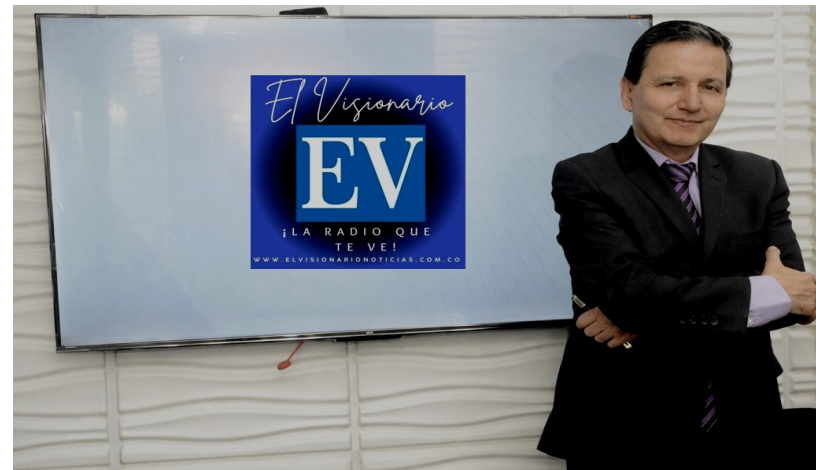
Por: Luis Guillermo Troya López - Periodista .

En estos días de agitado ambiente electoral y cuando el país busca tomar decisiones de importancia en materia política, el ejercicio periodístico toma vital importancia.