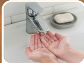
Desabastecimiento de agua

Un solo descuido en una fogata o colilla mal apagada destruye hectáreas de bosques y páramos.