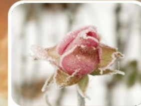
Pérdida de cultivos

Nuestros acueductos municipales entran en estado crítico si no disminuimos y racionalizamos el consumo.